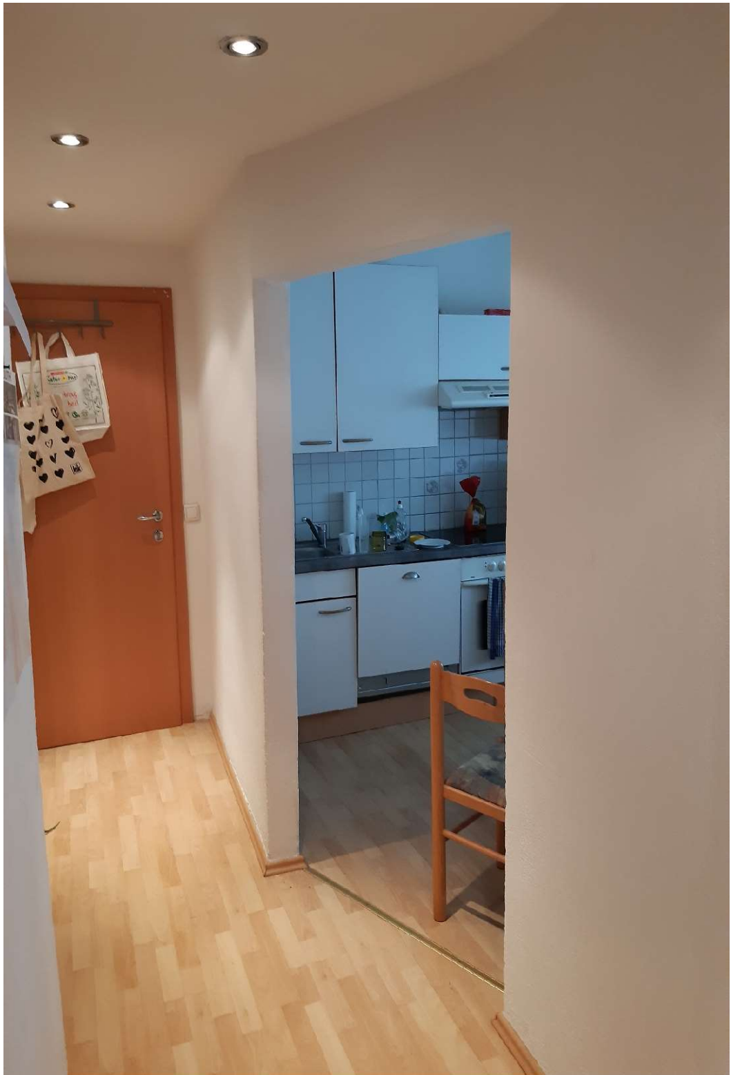
Top 2.1 48m 2 Miete+BK 500.-